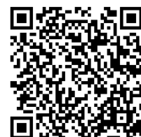
ナギの木苑無料送迎バス運行表