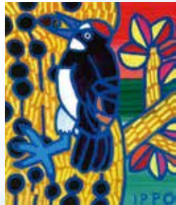
▲ドングリキツツキ(2022年)