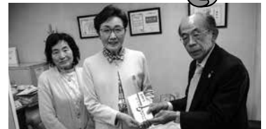
国際ソロプチミスト福岡やよい 様