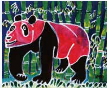
▲ピンクのパンダ(2011年)