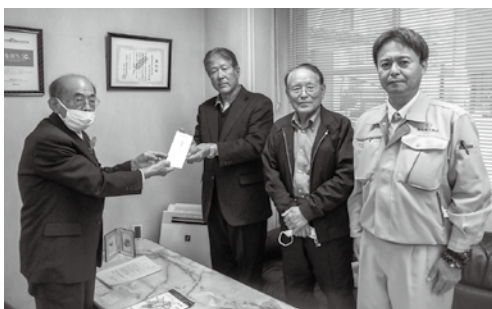
春日市建設業協力会