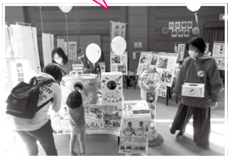
いきいきフェスタ春日2023