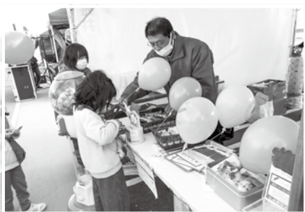
KASUGA ご当地グルメグランプリ