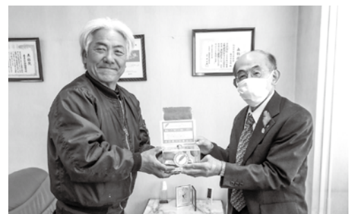
春日市緑樹協同組合