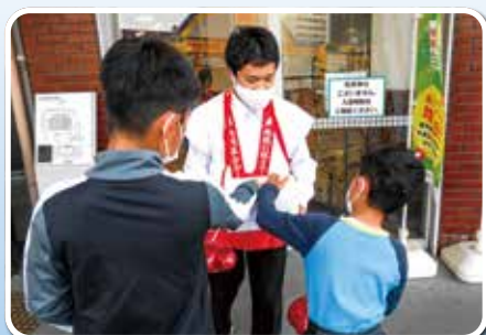
サニ宝町店での街頭募金