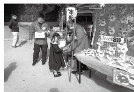
ぶどうの庭であい祭