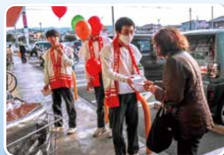
ルミエール春日店での街頭募金