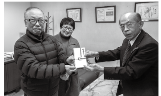
カッティンこにし