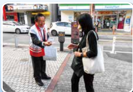
西鉄春日原駅での啓発活動