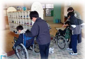
車いす・ポッチャ体験