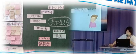
ふくし・共同募金・ボランティアについて