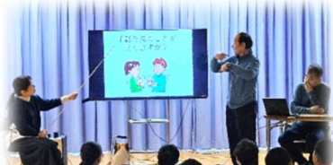
手話と聴覚障がいについて