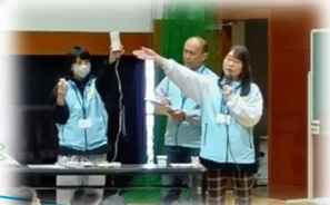
筆談と聴覚障がいについて