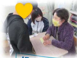
視覚障がいと点字体験